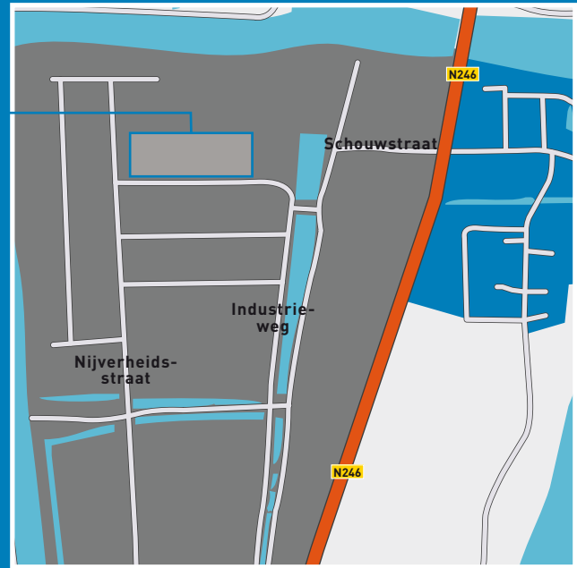
INDUSTRIEWEG 62 T/M 124