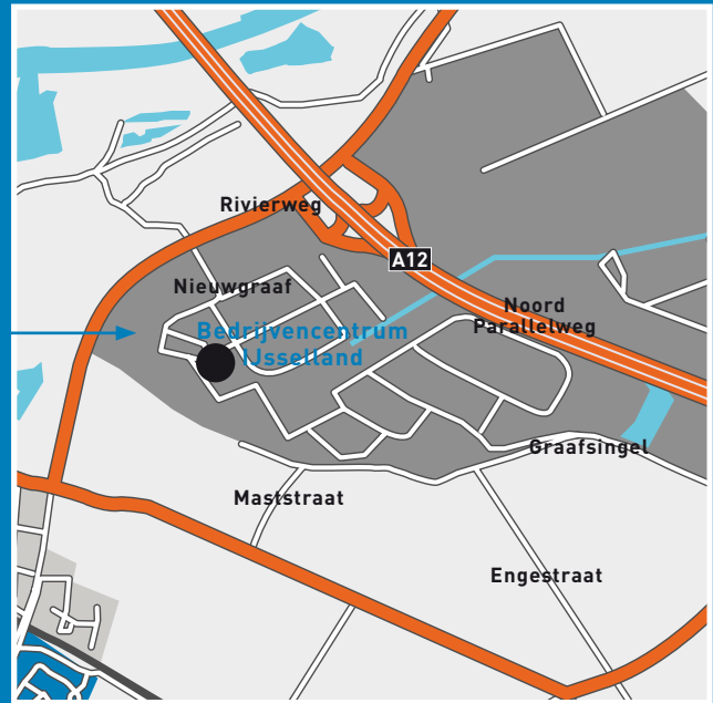
DIJKGRAAF 11 T/M 19 EN FOTOGRAAF 30 T/M 40